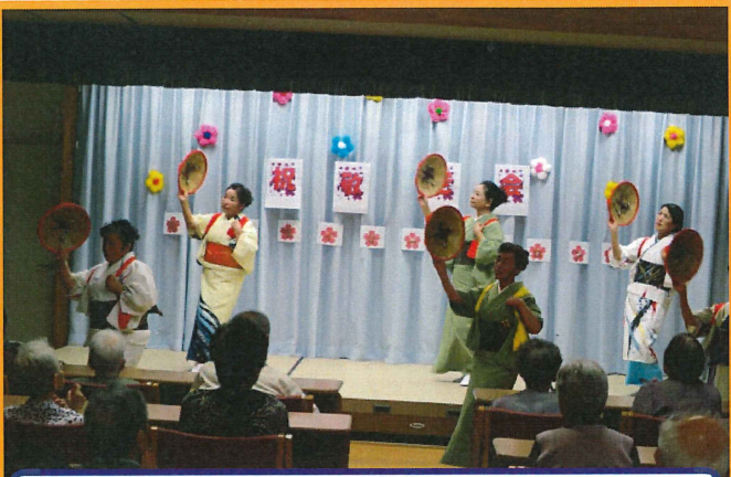
わらび会の皆様です♪