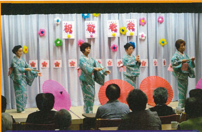
紫津喜の会の皆様です♪