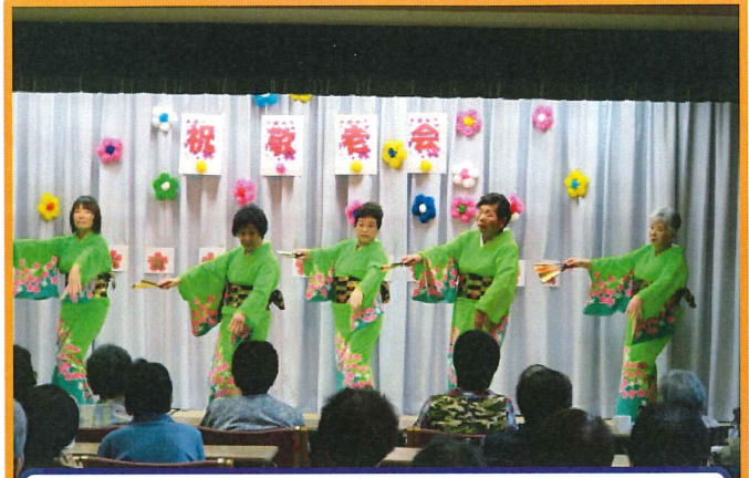
花園勝会の皆様です♪