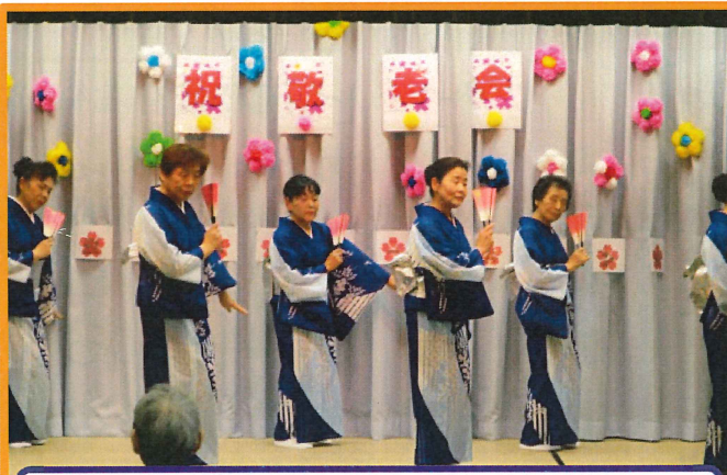
なのはな会の皆様です♪