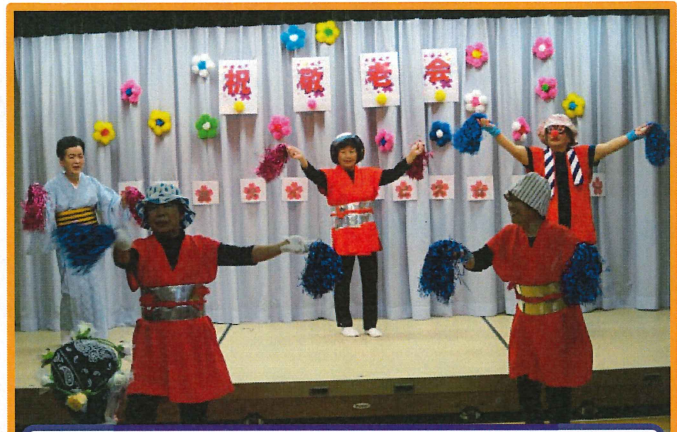
恵の会の皆様です♪