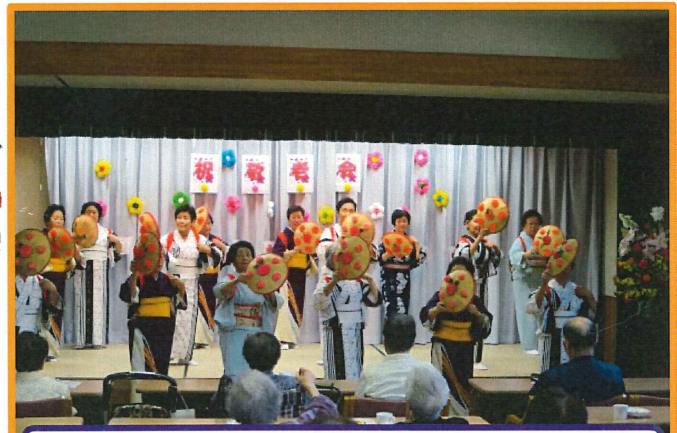
17民区女性部の皆様です♪