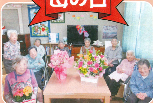
「家族から花が届きました。」