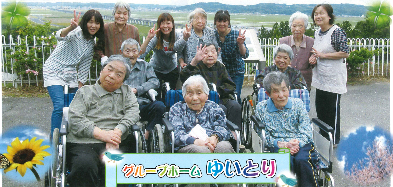
グループホーム ゆいとり