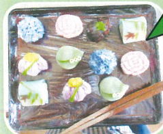
「ほっとスマイルの方々といっしょに〜」