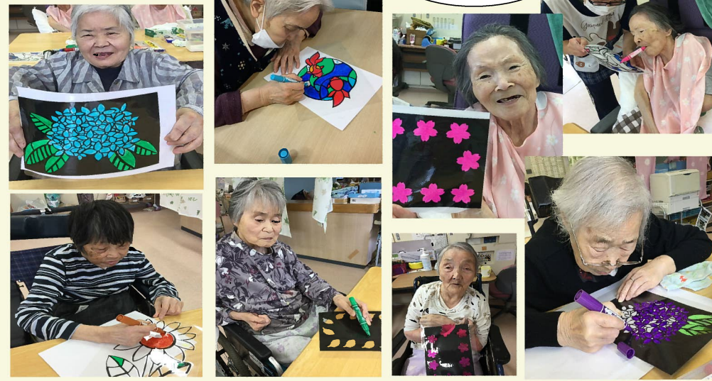
口にペンをくわえて色を塗りました！

桜グループです。桜グループでは利用者の皆さんとステンドグラス作りを行いました。桜グループのほとんどの方が参加し、ステンドグラスに一生懸命、色を塗っていました。完成した作品を利用者さん同士で見せ合ったり、職員に「綺麗でしょう。」と完成した作品を見せたりと楽しそうに取り組まれていました。完成したものを窓に張り付け光に反射させると「大したもんだ。」「綺麗だね。」と満足されていました。