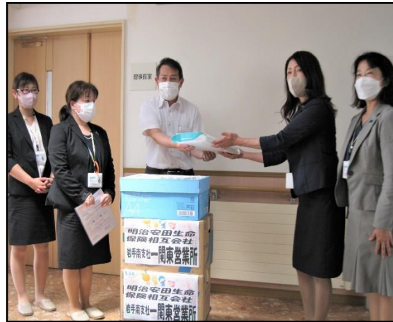
【明治安田生命一関東営業所様】