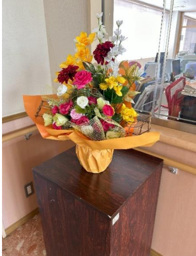
【一関婦人ボランティアの会様】