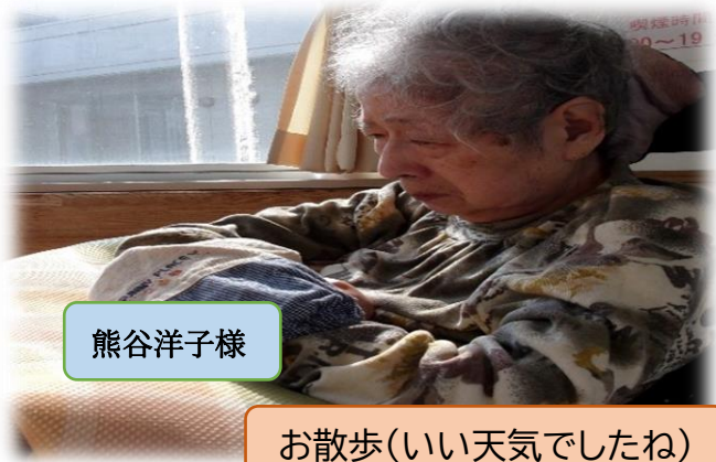
お散歩(いい天気でしたね)