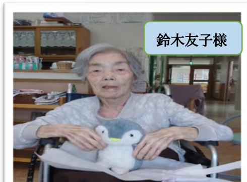
お誕生日おめでとうございます！